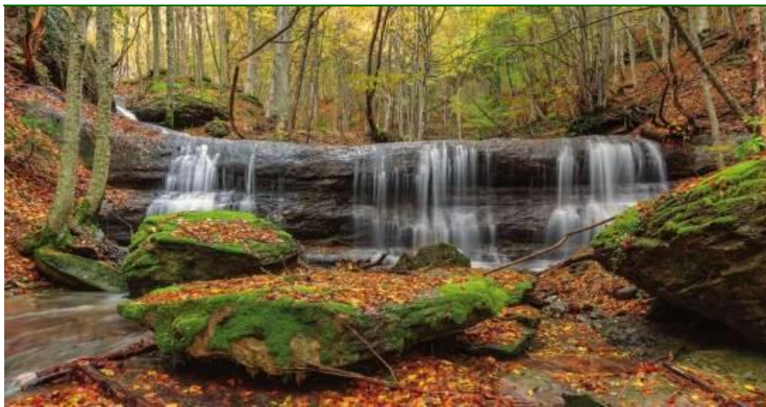
Particolare Foreste Casentinesi