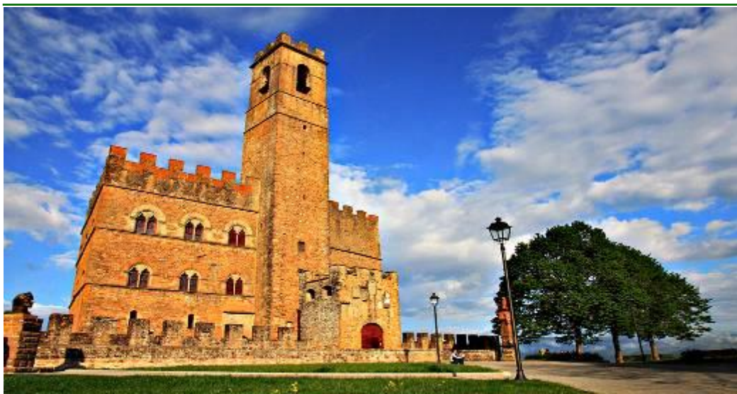
Particolare Castello di Poppi