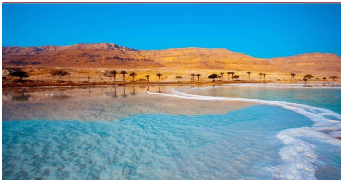
Particolare Mar Morto

Prima colazione in hotel. Giornata libera a disposizione per fare il bagno nelle caratteristiche acque. Il Mar Morto è un lago alimentato dal fiume Giordano , è un bacino unico al mondo lungo 75 chilometri e largo 15, situato a 400 metri sotto il livello del mare che rappresenta anche il punto più basso della superficie terrestre . Le sostanze minerali di cui è ricco non permettono che si sviluppi vita nelle sue acque, ma le stesse acque migliorano la vita grazie alle loro preziose proprietà curative dovute alla radiazione solare perfettamente filtrata, alle condizioni climatiche, all'atmosfera arricchita da ossigeno, alle sorgenti e ai trattamenti a base di sali e fanghi. Pranzo libero. Rientro in hotel. Cena e pernottamento.