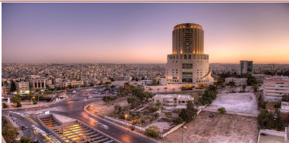
Particolare di Amman

Prima colazione in hotel. Dopo la colazione visita di Amman . La capitale del Regno Haschemita di Giordania, è una città moderna costituita totalmente da case di pietra bianca che fin dall'antichità è stata incrocio di vie di mercanti e di numerosi domini. Ammoniti, Romani, Ottomani hanno lasciato le tracce del loro passaggio in una città, che come Roma sorgeva su sette colli, e dove si possono ancora visitare numerosi resti tra i quali la cittadella, l'anfiteatro romano e il Museo del Folklore . Pranzo. Visita di Jerash , anticamente conosciuta con il nome di Gerasa , città che visse il suo periodo di massimo splendore sotto il dominio dei Romani. Oggi Gerasa costituisce una splendida testimonianza della grandezza e delle caratteristiche dell'opera di urbanizzazione condotta dai Romani nelle province dell'impero in Medio Oriente. Al termine della visita trasferimento ad Ajloun , dove ha sede il castello di Rabadh considerato uno dei maggiori esempi di architettura militare araba, che venne costruito nel 1184 dall'emiro Izz al-Dīn Usāma, nipote del grande Saladino, per proteggere le vie carovaniere ed i pellegrini dall'avanzata dei crociati. In serata rientro ad Amman. Cena e pernottamento in hotel.